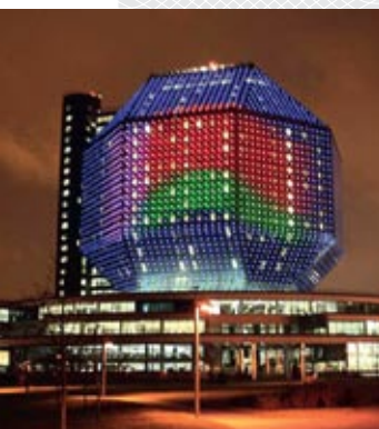
Национальная библиотека Беларуси