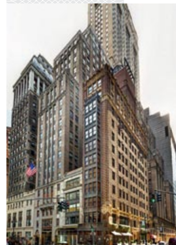
Library Hotel – отель-библиотека в Нью-Йорке