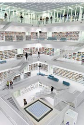
Штутгартская городская библиотека