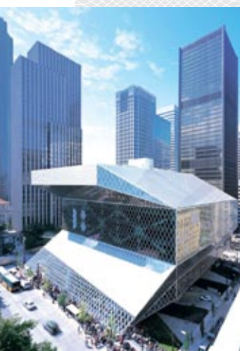
Публичная библиотека Сизэла

Это и краеведческий центр: в нем работают специалисты разного профиля, проводятся краеведческие исследования, международные научно-практические конференции и создаются электронные базы данных.