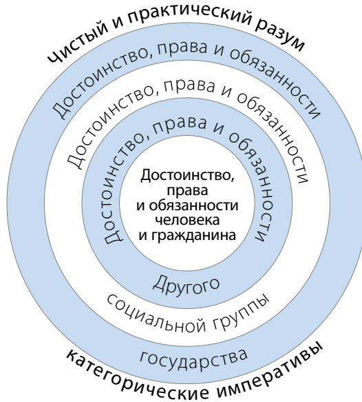
► Рисунок 4.

разума к должностованию, которое побуждает к поведению высокого социального и нравственного напряжения (рис. 4).