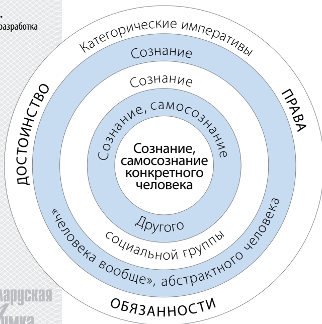
► Рисунок 3.

к тождеству, и по горизонтали, и по вертикали, и по диагонали отношений, все они становятся внутренними элементами друг друга и главной категории достоинства человека, как это иллюстрирует рисунок 2.