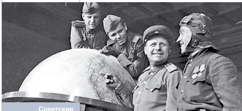
Советские солдаты и офицеры у глобуса в кабинете Гитлера. Берлин, май 1945 года

Театр «Современник» к 60-летию юбилею Победы поставил подлую пьесу «Голая пионерка», которая сопровождает