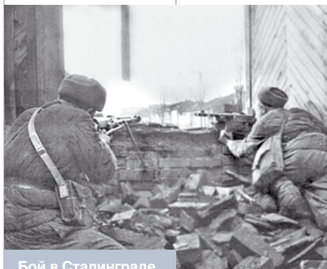
Бой в Сталинграде. Осень 1942 года

журнале корабля, в боевых рапортах командира конвоя и командира корабля. После войны это было подтверждено и немецкими документами. Но в России в 1994 и 1997 годах вышли две книги: «Морская война в Заполярье 1941–1945 гг.» и «Ленд-лиз и северные конвои 1941–1945 гг.», где авторы утверждают, что ту лодку U-286 потопили английские фрегаты. Вроде бы мелочь, но таких мелочей тьма. В целом это большая и хорошо финансируемая программа вытеснения из коллективной исторической памяти русских образа Отечественной войны. Эта программа уже проведена на Западе, и можно только поражаться ее эффективности. В середине 90-х годов на Западе с большим успехом прошел суперфильм «Сталинград». Оставляет тяжелейшее чувство именно тот факт, что миллионы образованных и разумных людей смотрят и даже восторгаются, хотя, сделав усилие, могли бы