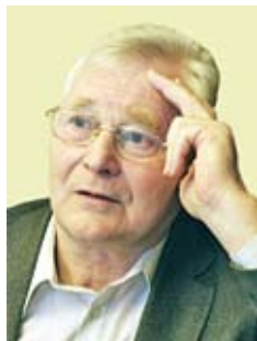
Сергей КАРА-МУРЗА, политолог, публицист (Россия)