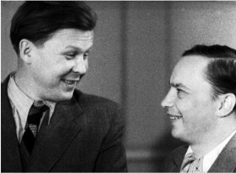
▲ А. Куляшоў і А. Твардоўскі. Мінск, 1949 год

Твардоўскі цудоўна ведаў беларускую мову, ён быў першы, хто заўважыў куляшоўскі талент. «Чытайце Куляшова. Не разменьвайцеся на другарадных асоб», – даволі часта гаварыў паэт, калі заходзіла размова пра беларускую паэзію.