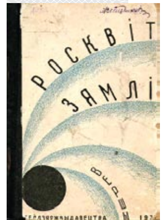
Вокладка першай кнігі А. Куляшова «Росквіт зямлі». 1930 год