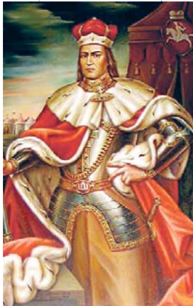
Вялікі князь літоўскі Вітаўт

У XIV стагоддзі пры двары вялікага князя літоўскага Альгерда былі досыць моцныя рускія ўплывы. Абедрэ жонкі Альгерда – Марыя, дачка віцебскага князя, і Уляна, княжна цвярская, – былі праваслаўнымі русінкамі. Яны спрыялі развіццю праваслаўя і рускай культуры ў Літве: закладалі тут цэрквы, стараліся выхоўваць сыноў у рускай традыцыі і г.д. Гедымінавічы, якія замянялі Рурыкавічаў у падпарадкаваных Літве рускіх княствах, у XIV стагоддзі былі ўжо звычайна праваслаўныя, хоць сам вялікі князь літоўскі заставаўся язычнікам. Наступнік Альгерда на велікакняжацкім троне Ягайла, хоць і не прыняў праваслаўнага хрышчэння, але