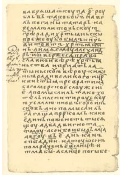
Старонка з летапісу Аўраамкі (XV ст.) са згадкай пра адрачэнне Вітаўта ад праваслаўя

Богъ на землю» [32, с. 139–140]. У летапісным зборніку Аўраамкі чытаем, што адступленне Вітаўта ад «хрысціянскай» веры навяло ў 1399 годзе на Кіеў татаруў [23, с. 145].