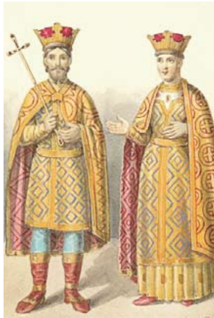
Маскоўскі князь Васіль Дзмітрыевіч з жонкай Соф'яй Вітаўтаўнай (рэканструкцыя)

Гэтыя набліжаныя да князя эліты ў абсалютнай большасці, як паказваюць даследаванні, складаліся з каталікоў-літоўцаў [10, с. 57–72], значную ролю ў акружэнні князя адыгрываў таксама каталіцкі віленскі біскуп [11, с. 25–30]. Такі стан рэчаў дадаткова зацвярджалі прывілеі 1387 і 1413 года, якія гарантавалі прывілеяванае становішча літоўскага баярства і ўскладнялі доступ да акружэння вялікага князя і ключавых дзяржаўных пасад асобам некаталіцкага веравызнання, г.зн. перадусім русінам. Свой двор Вітаўт