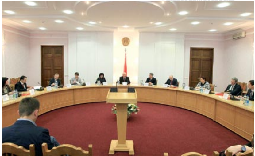
▲ Заседание межведомственной экспертной рабочей группы по рассмотрению рекомендаций БДИПЧ ОБСЕ по вопросам совершенствования избирательного процесса в Республике Беларусь. 2016 год

Учитывая пожелания и международных, и внутренних наблюдателей, Центризбирком предложил максимально снять ограничения на деятельность инициативных групп и агитационных групп поддержки кандидатов. По закону местные исполнительные и распорядительные органы должны определять места, где нельзя проводить пикеты по сбору подписей за выдвижение кандидатов. И некоторые исполкомы пошли по пути либерализации, указав, что подписи нельзя собирать только лишь возле зданий исполкома, судебных и правоохранительных органов. Другие же, наоборот, ужесточили условия, запретив сбор подписей возле магазинов, культурных учреждений, на автобусных остановках и т.д. Во втором случае мы настоятельно рекомендовали отменить решения и максимально разрешить список. Также исполкомы должны определять места, где кандидатам в депутаты разрешается проводить встречи с избирателями. Так, в некоторых городах, где население не меньше 70 тыс. человек, властями выделено всего два места. Наша рекомендация – максимально увеличить число точек для проведения встреч.