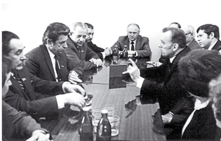
Обсуждение проблем профтехобразования на совещании в ЦК КПБ. 1980-е годы