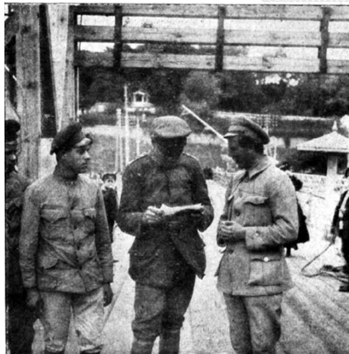
▼ Немецкий и советский переводчики на мосту через Днепр. Лето 1918 года

города 31 октября 1918 года, «после 8-месячной германской оккупации... в 12 часов германское командование сняло караулы с Днепровского моста. В город