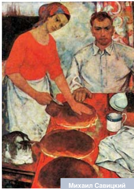
Михаил Савицкий «Хлеб». 1970 год

В чем проблема сегодняшнего бытия? В том, что человеку предлагают предаваться любым страстям, делать все, что он хочет, но только не увлекаться идеями, не отдаваться страсти к познанию. Ведь, как утверждают противники познания, «во многой мудрости много печали; и кто умножает познания, умножает скорбь». Поэтому вместо познания обществу предлагают шоу. И никакой печали! У нас развелось много адвокатов, астрологов, шоуменов, но мало философов, мыслителей. Отсюда и все наши проблемы, так как не зрелища и рыночная экономика, а философия спасет мир. ▀