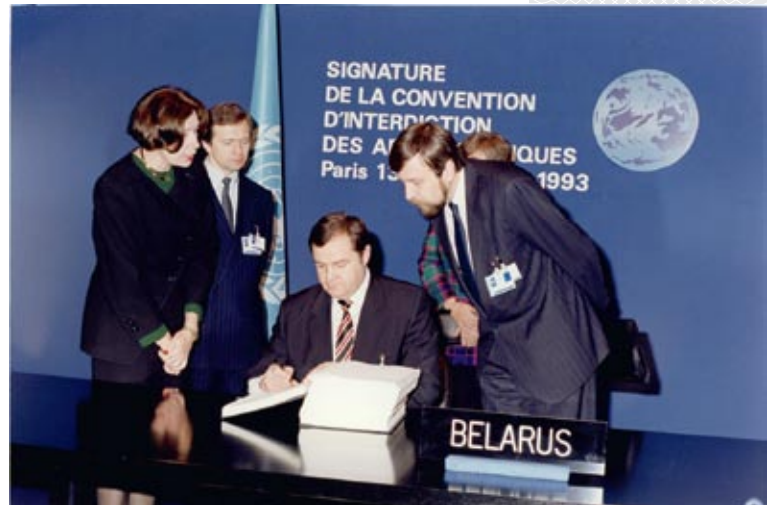
▲ Первый международный договор, подписанный Беларусью как суверенным и независимым государством. Париж, 1993 год

Наиболее плодотворным в истории нашей дипломатии стал период, охватываю-