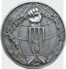
▼ Эмблема фонда «Взаимопонимание и примирение»

за 50 лет ООН выпустила марку и конверт, посвященные Беларуси.