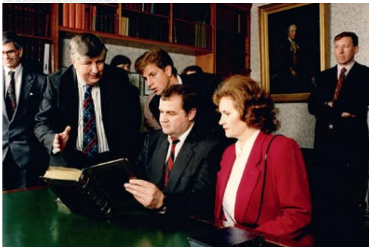
▲ В Лондонской публичной библиотеке: знакомство с Библией Ф. Скорины. Октябрь 1993 года

фонда «Взаимопонимание и примирение» и распределялись им среди 147 503 граждан нашей страны. Из германского фонда «Память, ответственность и будущее» денежные компенсации получили еще около 130 тыс. жителей нашей страны – сумма составила 345 млн евро. С чувством гордости могу сегодня заявить, что я был первым дипломатом и политиком в бывшем СССР, который не только увидел данную проблему, но вместе с коллегами из России и Украины добился ее успешного решения. Как это происходило, я подробно рассказал в двух своих книгах, посвященных новейшей истории Беларуси.