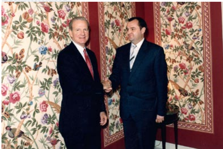
▲ П.К. Кравченко с Госсекретарем США Дж. Бейкером. Нью-Йорк, 30 сентября 1991 года

сетило более 100 официальных делегаций, в том числе ряд на высшем уровне.