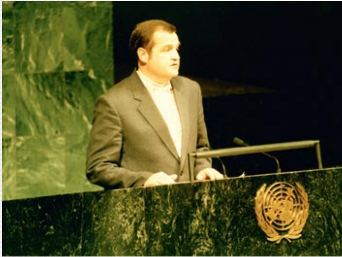
▲ Выступление на сессии Генеральной Ассамблеи ООН. Октябрь 1991 года

Генеральной Ассамблеи ООН, что и было сделано 4 декабря 1990 года. Эта дата вошла в историю нашей страны и мирового сообщества как день принятия первого международно-правового акта, квалифицирующего Чернобыль в качестве «явления беспрецедентных масштабов» и подчеркивающего вселенский, универсальный и долговременный характер последствий катастрофы.