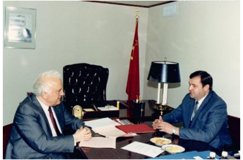
▲ Трудные переговоры с министром иностранных дел СССР Э.А. Шеварднадзе. Нью-Йорк, сентябрь 1990 года

В ходе этой работы пришлось преодолеть и сопротивление некоторых западных стран, которые явно недооценивали важность данной проблемы и полагали, будто белорусы обращаются к мировому сообществу за помощью для лечения застарелых социальных «болячек» в медицинской и других сферах, исходя из конъюнктурных соображений.