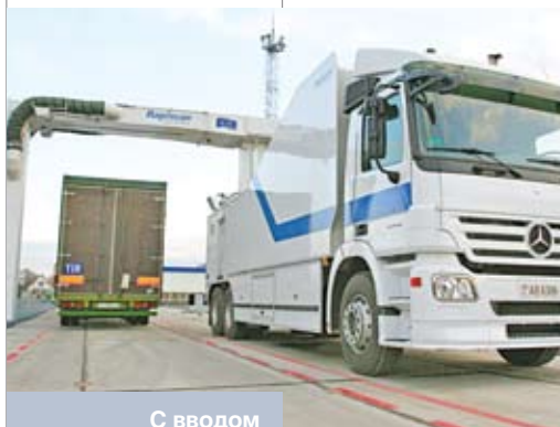
С вводом в эксплуатацию инспекционно-досмотрового комплекса осмотра любого транспортного средства на грузовом терминале в пункте пропуска «Козловичи-2» занимает не более 5 минут

Для нашего государства в геополитическом плане видятся, по меньшей мере, четыре важнейших перспективных фактора, которые способны умножить его силу: в политическом плане – суверенитет; в экономическом – создание транзитной зоны, интегрированной в европейское экономическое пространство, и наращивание экспорта товаров и услуг; в социальном – укрепление человеческого потенциала. Данным факторам необходимо подчинить всю жизнедеятельность страны, а способами достижения поставленных задач должны стать наука,