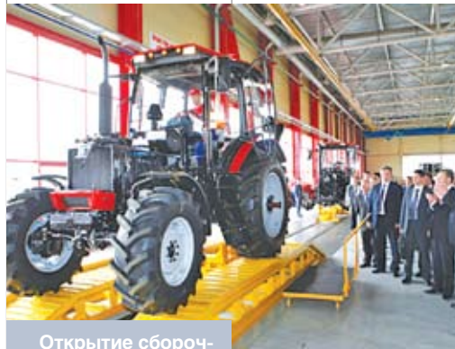
Открытие сборочного производства тракторов «Беларус» в Елабуге (Республика Татарстан, Россия). Май 2010 года

Учитывая, что мы находимся в геополитическом пространстве влияния России и этот рынок является для нас и желанным, и важнейшим, ситуация требует не «войны» с российскими производителями, а реализации комплекса мер упреждающего характера. Среди них – диверсификация экспорта, создание совместных предприятий, поиск новых партнеров в федеральных округах, восстановление нарушенных ранее и налаживание новых производственных связей, поддержка инициатив, связанных с созданием в российских регионах дилерских сетей, логистических и сервисных центров по сбыту и техническому обслуживанию белорусской продукции. И, конечно же, нужна предметная работа по повышению качества и конкурентоспособности наших товаров.