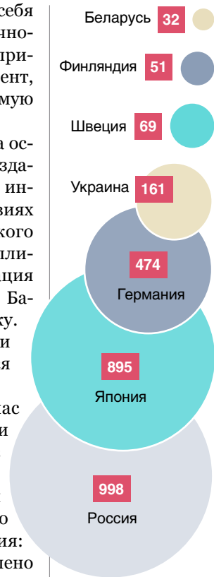
Рисунок 1. Число занятых НИР в некоторых странах мира (тыс. человек)

Экономисты подсчитали, что чисто технически воплощение на белорусской земле финской или шведской модели потребует десятикратного удельного роста расходов на исследования и разработки при трехкратном увеличении численности их исполнителей. Учитывая нашу национальную специфику, когда частный сектор пока еще весьма и весьма незначительно финансирует научные исследования, государство должно неуклонно доминировать в этом процессе. Для сравнения приведем