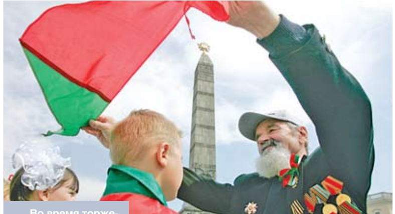
Во время торжественного приема в пионеры на площади Победы в Минске

Скажут: ведь охранители проиграли, надо ли брать на вооружение психологию проигравших? Но разве они проиграли? Разве не говорят ныне в России о важности духовных достижений православия? Разве не утверждают там собственную политическую самобытность? (Вспомним известный тезис о суверенной демократии.) Разве не