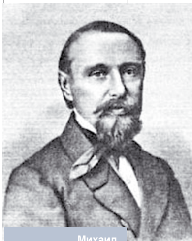
Михаил Никифорович Катков

Получается, весь вопрос в том, что и как охранять. Если речь идет о государстве, национальных интересах, праве на собственное понимание национальных ценностей, то смысл в этом есть, и немалый. Что же касается «прогресса», «либеральных ценностей», «коммунистических ценностей», то, очевидно, они могут быть приняты сами по себе, но с учетом