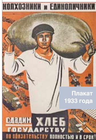
Плакаты 1933 года