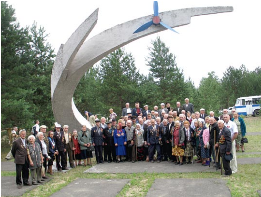
◀ Группа ветеранов Великой Отечественной войны Любанского района на мемориальном комплексе «Остров Зыслов» во время празднования Дня Победы. Коллективное фото сделано на фоне памятного знака, установленного на месте, где начиналась взлетно-посадочная полоса партизанского аэродрома. 1990-е годы

появлялось все больше и больше. В конце осени 1941-го их уже насчитывалось 33 и местом своей дислокации большинство из них выбрало все те же окрестности деревни Загалье. Данная территория пользовалась у народных мстителей популярностью как минимум по двум причинам: она располагалась в труднодоступной лесной сильно заболоченной местности и находилась под полным контролем партизан.