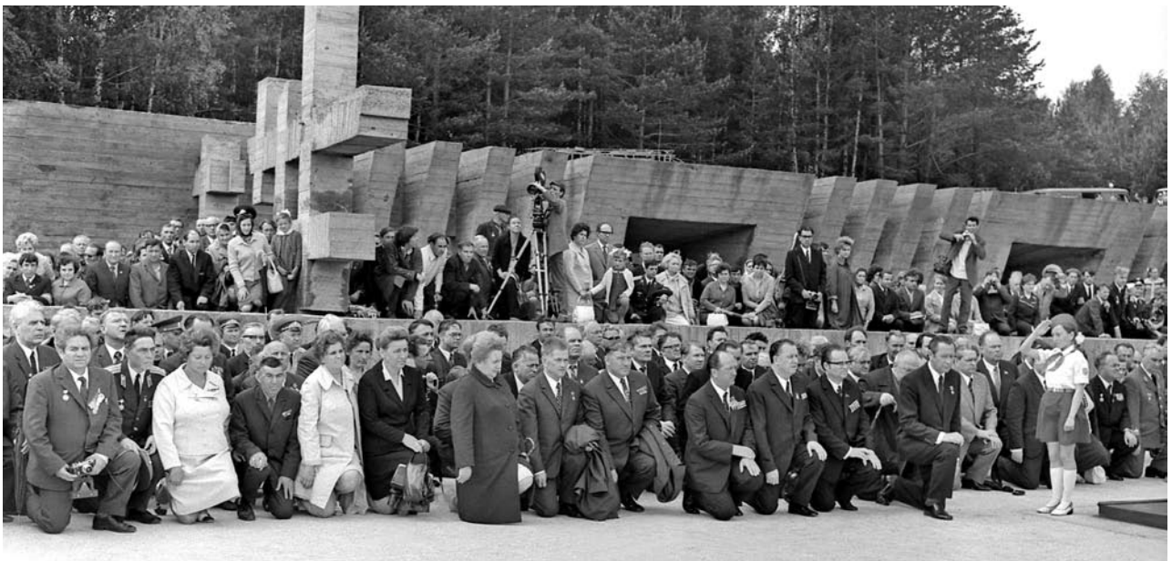
Митинг памяти жертв фашизма в Хатыни. 1974 год

После открытия мемориального комплекса «Хатынь» в постпредстве Совмина БССР в Москве организовали выставку, посвященную мемориалу. На открытие пришла министр культуры СССР Е. Фурцева. Л. Левин вспоминает, что, ознакомившись с чертежами и фотографиями, она разразилась яростной тирадой: «Почему Москва не знала? Это что за работа? Это же издевательство над искусством! Что скажут потомки, когда увидят такого старика? Оборванного, несчастного... Неужели