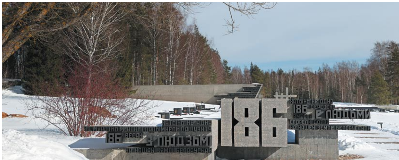
Обновленный мемориальный комплекс, как и прежде, сурово напоминает о сестрах Хатыни – белорусских деревнях, сожженных вместе с жителями во время Великой Отечественной войны

езде и всюду. Власти проводили титаническую работу, пытаясь определить количество погибших и масштабы разрушений.