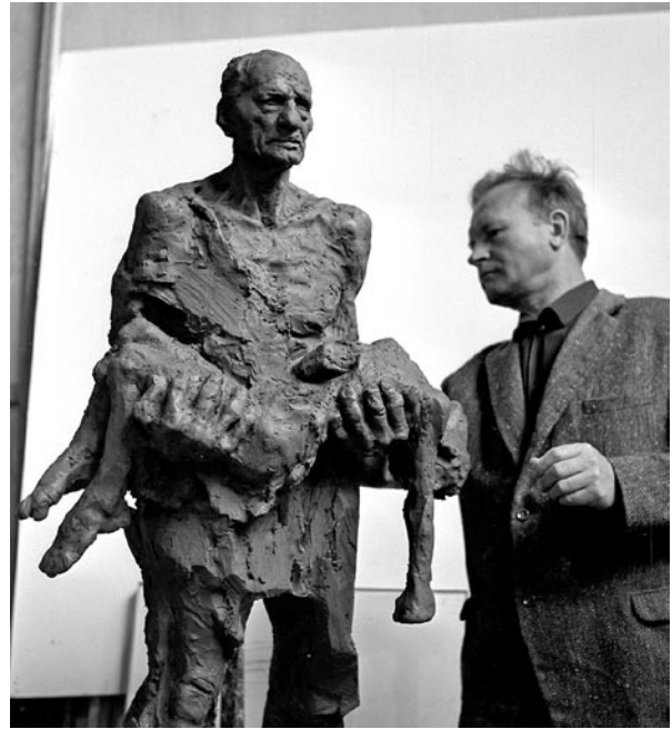
Народный художник БССР Сергей Селиханов – автор всемирно известной скульптуры «Непокоренный человек» в мемориальном комплексе «Хатынь». 1968 год

Поначалу речь шла о создании мемориального знака, потом о музее-заповеднике и музее-памятнике. 30 декабря 1965 года министр культуры БССР М. Минкович направляет первому секретарю ЦК КПБ письмо, в котором читаем следующие строки: «в целях увековечивания памяти... считаем необходимым на месте