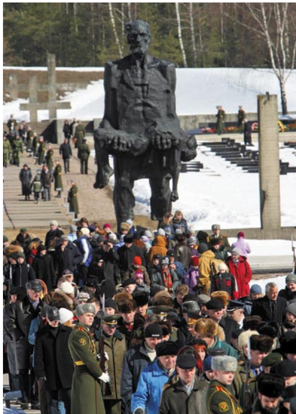
За более полувека мемориальный комплекс «Хатынь» посетили миллионы людей со всего мира. 2003 год

нельзя было поставить фигуру солдата, спасшего детей? Кто разрешил все это? Здесь и близко нет нашего искусства! Памятник нужно сносить. Под бульдозер!».