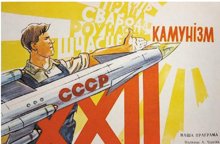
Малюнак у часопісе «Вожык» № 15 за 1961 год

Сімвалам камуністычнай будучыні з’яўляліся атамная энергетыка, кібернэтыка, вялікая хімія. І, вядома, засваенне чалавекам космасу: першыя касмічныя палёты прадэманстравалі перавагу навукі над рэлігіяй, яны дэсекулярызавалі неба, перш за ўсё ў вачах моладзі. Касмічная тэма зрабілася адной з галоўных у савецкай інфармацыйнай прасторы. Афіцыйныя паведамленні аб новых запусках, каментары вучоных, вершы, малюнкi змяшчаліся на першых палосах і вокладках беларускіх газет і часопісаў. Дзяржаўная прапаганда прадстаўляла савецкія перамогі ў космасе як важкі доказ перавагі сацыялізму над капіталізмам. Абсалютная большасць насельніцтва шчыра падзяляла гэту ідэалагему і ганарылася выдатнымі дасягненнямі сваёй краіны ў засваенні космасу.