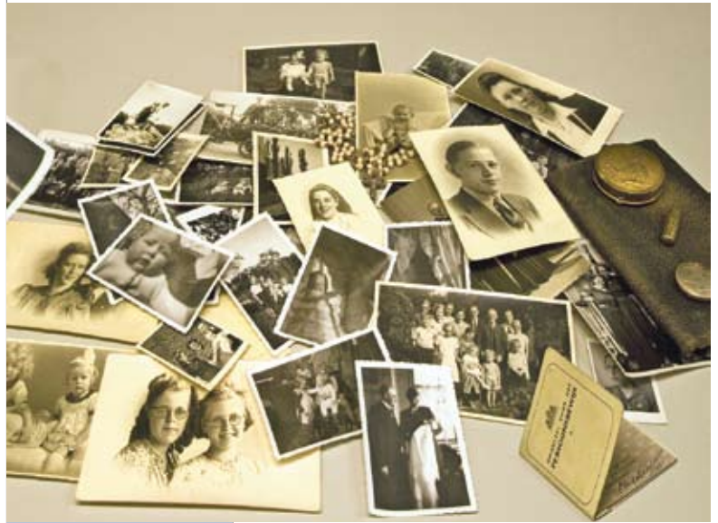
Снимки из фондов архива

Допускают ли исследователей к информации, содержащей персональные данные?