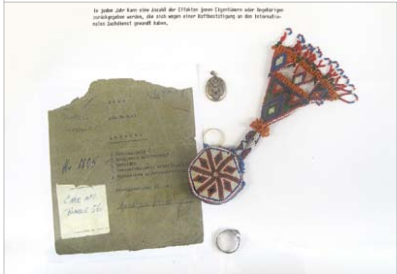
Личные вещи бывших узников

В прошлом году на сайте Международной службы розыска выставили составленный в алфавитном порядке список бывших узников, которым принадлежали эти вещи. Так что теперь проверить, нет ли среди них