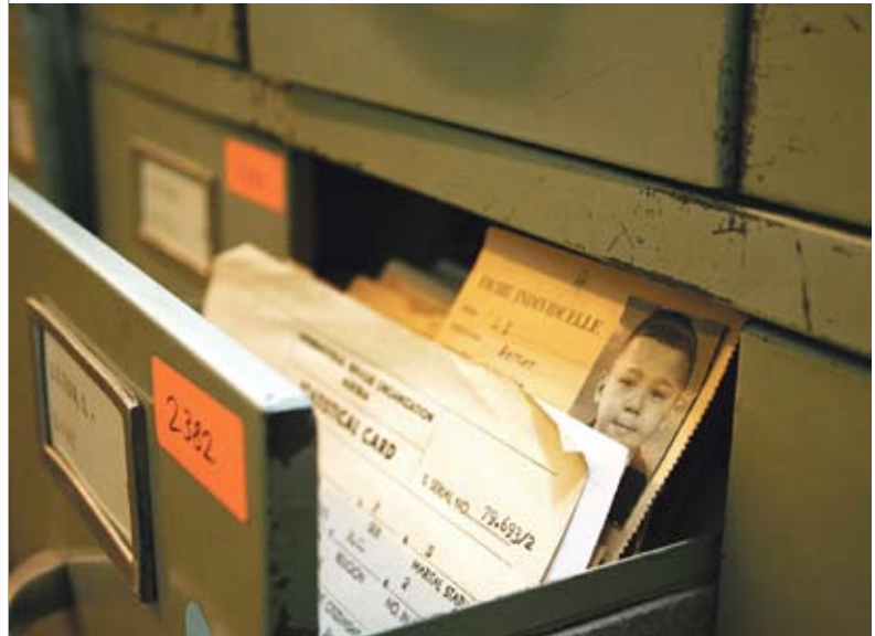
Личные карточки детей войны

Большая база данных собрана в Бад-Арользене на детей войны. Среди них и дети бывших оstarбайтеров, разлученные с родителями и отправленные в концлагеря Германии, и специально вывезенные из Восточной Европы малыши со светлыми волосами и голубыми глазами – они усыновлялись семьями членов СС в рамках так называемой «германизации», их имена и фа-