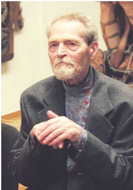
М.А. Савицкий. 2004 год

...Творческое наследие выдающихся личностей, их биографии становятся частью национального достояния страны. Недальновидно и бессмысленно было бы отрицать значимость фигуры М.А. Савицкого для Беларуси, для мировой культуры. Думается, что сегодня и на уровне страны в целом, и на уровне каждого гражданина в отдельности следует прийти к пониманию – это был государственный человек и государственный художник в лучшем смысле этих слов. ▀