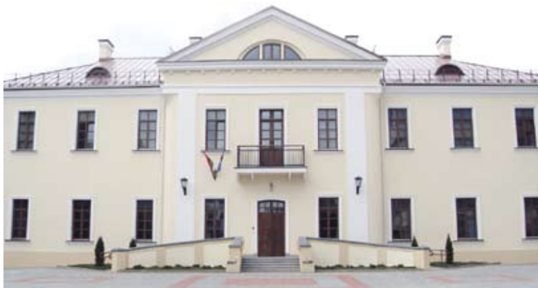
Галерея М.А. Савицкого в Минске

В 2005 году М.А. Савицкий говорил: «Сейчас в мире идет агрессия против сла-