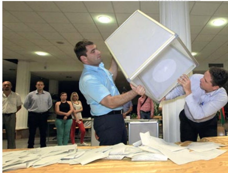
▲ Наблюдатели следят за выемкой бюллетеней на участке № 153 Ленинского района Минска