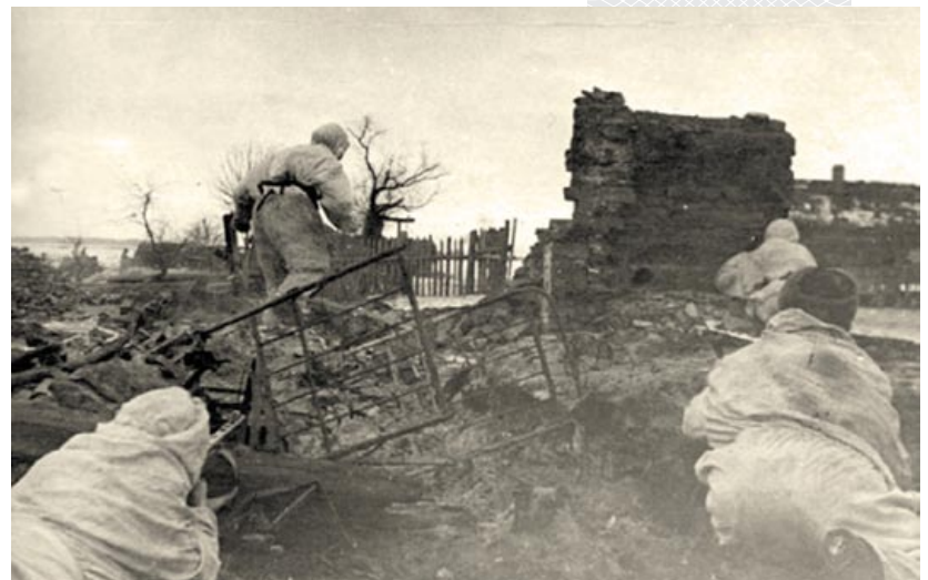
▼ Бой савецкіх аўтаматчыкаў за Рагачоў. Люты 1944 года