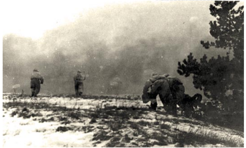
▲ Наступленне пяхоты пад покрывам дымавой завесы. Раён г. Рагачова. Люты 1944 года

Нягледзячы на тое, што войскам 1-га Беларускага фронту не ўдалося авалодаць Рагачовам, як меркавалася, у дзень свята Чырвонай арміі, вызваліцелям горада ад нямецка-фашысцкіх захопнікаў была