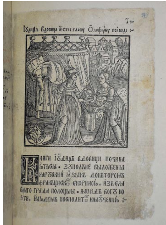
Тытульны аркуш прадмовы Францыска Скарыны да кнігі «Юдзіф» (1519)

У вершы Янкі Купалы «Мая малітва» такая ж з'яднанасць знакавых прасторавых канцэптаў прыроднай гарызанталі і духоўнай вертыкалі афармляе ўніверсальна-сакральную сістэму каардынат, у якой спалучана і адбываецца гісторыка-культурнае здзяйсненне і быццёвая рэалізацыя народна-нацыянальнай супольнасці: