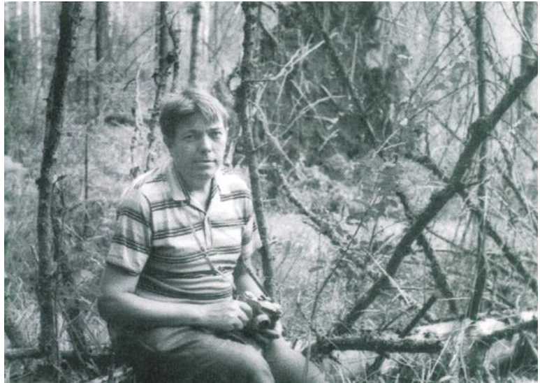
Уладзімір Караткевіч. 1965 год

Суадносіны з іншасцю У. Караткевіч непасрэдным чынам звязвае з развіццём асобы, яе маральнай матываванасцю не толькі прыняць чужое, але і ўступіць з ім у насычаны і прадуктыўны дыялог на роўных, выяўляючы пры гэтым уласныя