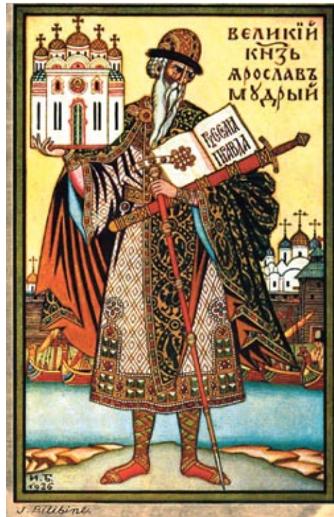
◀ Вялікі князь Яраслаў Мудры. Мастак І.Я. Білібін, 1926 год

Такім чынам, масавае з’яўленне ўсходнеславянскага насельніцтва ў рэгіёне, асновы цывілізацыйнасці, распаўсюджванне дзяржаўнай арганізацыі, узнікненне га-