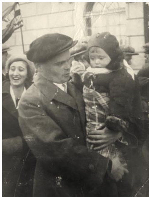
► Наташа с папой. Фото сделано за год до войны

Она вспоминает, что в том далеком 1941 году самым страшным для нее, маленькой девочки, был не артобстрел или