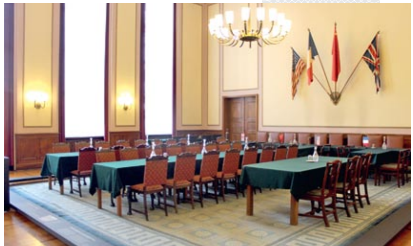
▼ Мемарыяльная зала музея – тут 8 мая 1945 года быў падпісаны акт аб безагаворчай капітуляцыі Германіі

Наступная экспазіцыя, разгорнутая на другім паверсе будынка музея «Берлін-Карлсхорст», адлюстроўвае два погляды на вайну – савецкі і нямецкі. У размешчаных тут залах з абсалютна чорнымі