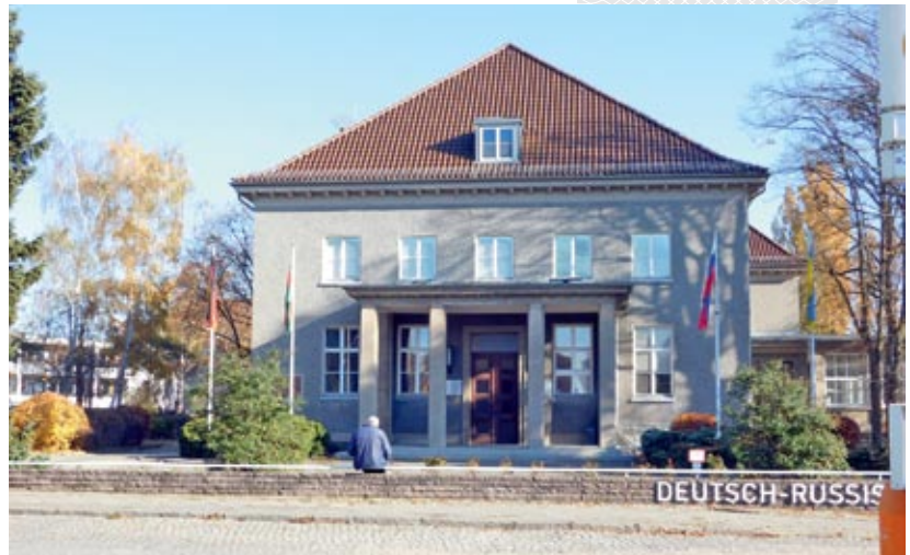
▲ Будынак Герман-Рэйскага музея «Берлін-Карлсхорст»

Ад імя савецкага камандавання акт аб капітуляцыі Германіі падпісаў маршал Г. Жукаў, ад камандавання саюзнікаў – галоўны маршал брытанскіх Ваенна-паветраных сіл А. Тэдэр. У якасці сведак подпісы пад дакументам паставілі амерыканскі генерал К. Спаатс і галоўнакамандуючы французскай арміяй генерал Ж. дэ Латр дэ Тасіны. Ад Германіі акт капітуляцыі падпісалі начальнік штаба вярхоўнага галоўнакамандавання вермахта генерал-фельдмаршал В. Кейтэль, галоўнакамандуючы ваенна-