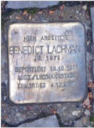
▲ Латунныя таблічкі, устаноўленыя ў памяць пра канкрэтнага чалавека, які на тым месцы загінуў ад рук фашыстаў, даволі часта сустракаюцца на берлінскіх тратуарах

гедый, што прыносяць нам войны, мы пакідалі берлінскі Мемарыял памяці забітых яўрэяў Еўропы.