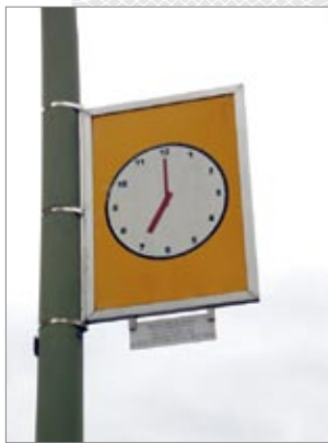
▲ Гэтая таблічка – неад’емная частка экспазіцыйнай прасторы Баварскага квартала

Сяргей ГАЛОЎКА Мінск – Берлін