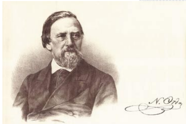
▲ Аўтапартрэт Напалеона Орды

У Свіслачы юнак уліўся ў асяроддзе аднадумцаў, выхадцаў з беларускай шляхты, якія марылі пра незалежнасць зямель былой Рэчы Паспалітай. Аб'яднаўшыся ў сваіх поглядах, яны стварылі тайнае таварыства «Заране», актыўным членам якога стаў і Напалеон Орда. Назва арганізацыі паходзіла ад часу правядзення патаемных сходак: на іх гімназісты збіраліся надвечоркам, калі ў небе з'яўляліся зоркі. Аднак намеры ў гэтых высакародных летуценнікаў былі зусім не рамантычныя – «заранаўцы» выказвалі свой пратэст супраць палітыкі царскіх улад, запальвалі рэвалюцыйнымі настройамі іншых гімназістаў, ім нават удалося схіліць на свой бок некалькіх выкладчыкаў. Зразумела, што такія паводзіны малалетніх патрыётаў не маглі не трапіць пад увагу паліцыі. Найбольш актыўных з іх, у тым ліку і Напалеона Ор-