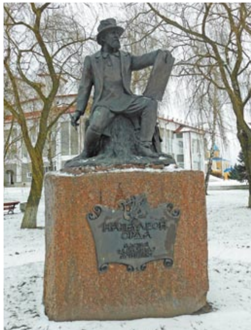
► Помнік Напалеону Орду ў горадзе Іванава

Не толькі Парыж з яго вялікай гістарычнай спадчынай і непаўторным маляўнічым каларытам натхняў мастака. Напалеон адчуў у сабе вялікую прагу да творчых падарожжаў. Штогод у летнія месяцы ён вандраваў па Францыі, наведваў Партугалію, Іспанію і асобныя рэгіёны Прусіі. З вялікім імпэтам і захапленнем мастак працаваў з натуры, выбіраючы для адлюстравання мясціны, напоўненыя рамантычнымі чарамі, – напярэбраныя замкі, утульныя вясковыя сядзібы, мястэчкі. Пазней Н. Орда прызнаваўся: калі адлюстроўваў тое, што да яго не прыкмячаў ніводны іншы пейзажыст, то ён адчуваў сябе першаадкрывальнікам. Па сутнасці гэта так і было. Менавіта Н. Орда ў сваіх малюнках змог аб'яднаць звычайнае і рамантычнае, падаць сюжэт цікава і захапляльна.