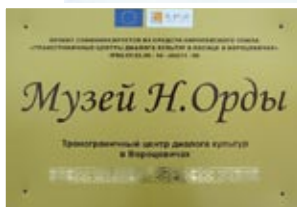
▲ Музей Напалеона Орды у вёсцы Варацэвічы

змаглі высачыць студэнтаў-патрыётаў. Іх арыштавалі, яны адразу ж былі выключаны з універсітэта. На гэты раз зняволенне для Напалеона і дзесяці яго сяброў па вучобе і палітычнай барацьбе аказалася значна больш працяглым – цэлых 15 месяцаў, пакуль ішло следства, правялі яны ў турме.