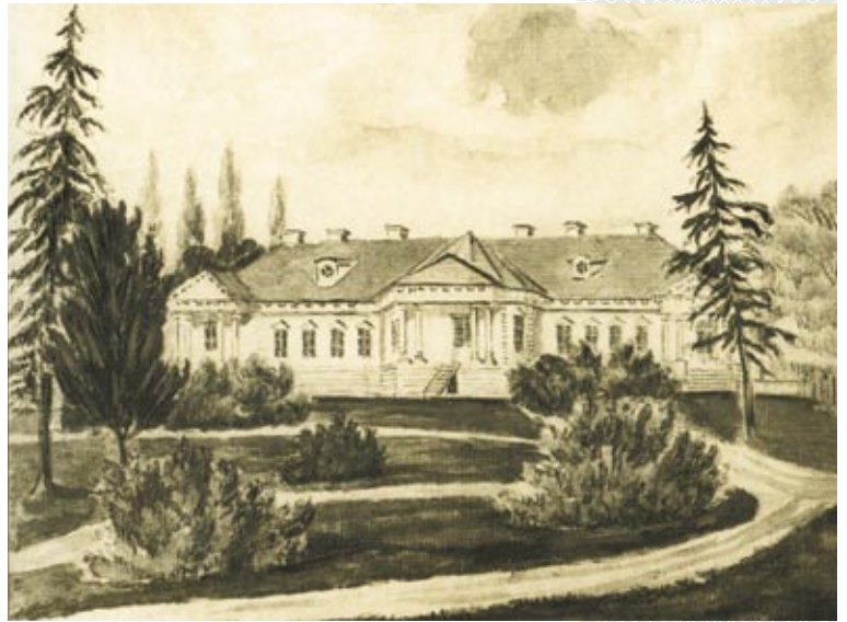
▲ Палац Скірмунтаў у вёсцы Моладава. Малюнак Н. Орды. 1864 год

Прамых сведчанняў пра ўдзел Напалеона Орды ў паўстанні 1863–1864 гадоў