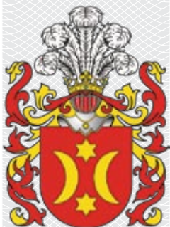
▲ Герб роду Ордаў

Споўнілася 210 гадоў з дня нараджэння мастака і кампазітара, які творча ўслаўляў Беларусь