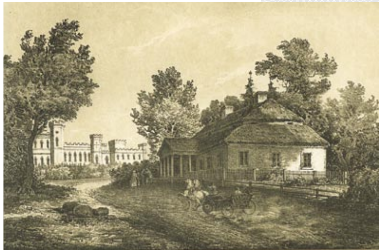
▲ Сядзіба Касцюшкаў у фальварку Мерачоўшчына каля Косава. Малюнак Н. Орды

Эмігранцкі шлях Н. Орды пралягаў праз Аўстрыю, Швейцарыю, Італію, але яго мэтай было дасягнуць Парыжа і знайсці там прытулак. Улады тагачаснай Францыі з разуменнем ставіліся да выгнаннікаў з былой Рэчы Паспалітай, тым не менш паліцыя падазрона аднеслася да грамадзяніна Расіі Завадскага і пачала сачыць за ім. «Таму я, каб пазбегнуць непрыемнасцей, – адзначаў пазней Н. Орда ў сваіх успамінах, якія пісаў для сына Вігольда, – і маючы знаёмых сярод ваенных, якія маглі б засведчыць сапраўднае маё імя, сам пайшоў у паліцыю і пакаўся, што я эмігрант...». Дзякуючы гэтаму прызнанню і ўплывовым сувязям землякоў, праблему ўдалося ўладзіць: Напалеону выдалі «ліст адкрытага знаходжання» – своеасаблівы від на жыхарства, як эмігранту прызначылі штомесячную дапамогу і дазволілі жыць у Парыжы.