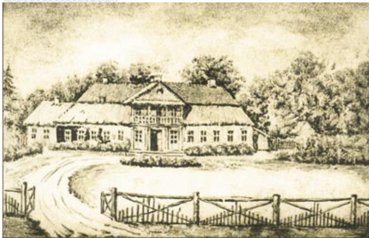
▼ Сядзіба Ордаў каля Варацэвічаў. Малюнак Н. Орды. 1860 год

Орда быў інжынерам-фартыфікатарам, маршалкам шляхты Кобрынскага павета, а маці Юзафіна нарадзілася ў сям'і пінскага суддзі і мечніка Матэвуша Бутрымовіча. Паводле сямейнага падання, род Ордаў паходзіў ад татарараў Залатой Арды. Далёкі продка Напалеона ў канцы XIV стагоддзя быў запрошаны вялікім князем літоўскім Вітаўтам да сябе на вайсковую службу. Яго нашчадкі таксама станавіліся ваярамі і, прыняўшы хрысціянства, засвоіўшы мову, культуру сваёй новай радзімы, аддана служылі ёй, абараняючы ад захопнікаў, за што атрымлівалі высокія пасады, тытулы і радавыя гербы.