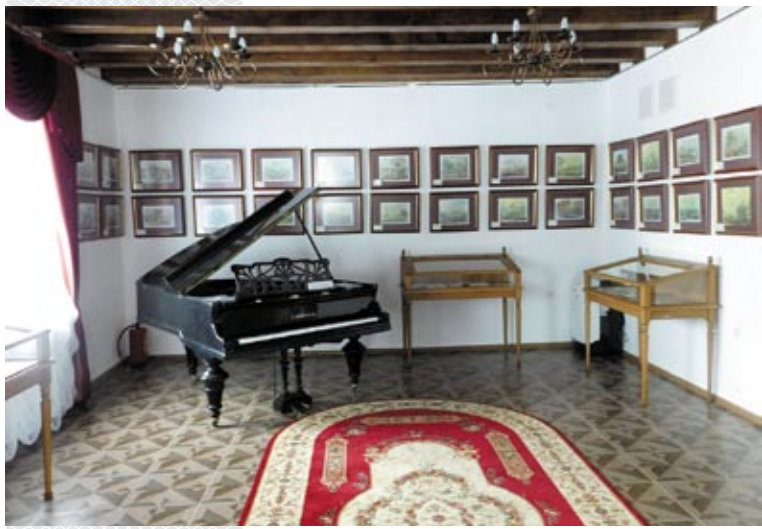
▼ Адна з экспазіцыйных залаў музея

адаслала сваё прашэнне, вырашыў яшчэ і паздекавацца з прыгнечанай горам жанчыны – ён распарадзіўся спагнаць з яе грошы за выкарыстаную для напісання адказу, зразумела ж, адмоўнага, паперу.