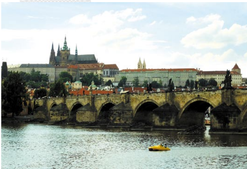
▼ Від на Градчаны; на пярэднім плане – Карлаў мост

Як вядома, у 1520 годзе наш зямляк пакінуў чэшскую сталіцу. Паводле адной з версій, з-за эпідэміі чумы, што чарговы раз там разгулялася, і пераехаў у Вільню,