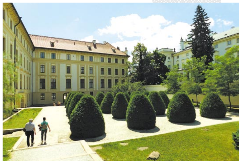
▼ Каралеўскі сад у Празе ў свой час праектаваў знакаміты палачанін Францыск Скарына