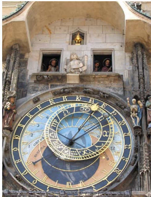
◀ Пражскі астранамічны гадзіннік – так званы арлой

Засноўваць у чэшскай сталіцы ўласную друкарню Ф. Скарыну было немэтазгодна. Як чалавек прагматычны, ён, канечне ж, умеў лічыць грошы. Таму, каб зменшыць выдавецкія выдаткі, мусіў звярнуцца да паслуг адной з ужо існаваўшых у горадзе друкарскіх мануфактур. А вось якой канкрэтна? Тут зноў жа і скарыназнаўцы, і даследчыкі пражскай мінуўшчыны разыходзяцца ў меркаваннях. Бо захавалася вельмі мала дакументальных сведчанняў пра тое,