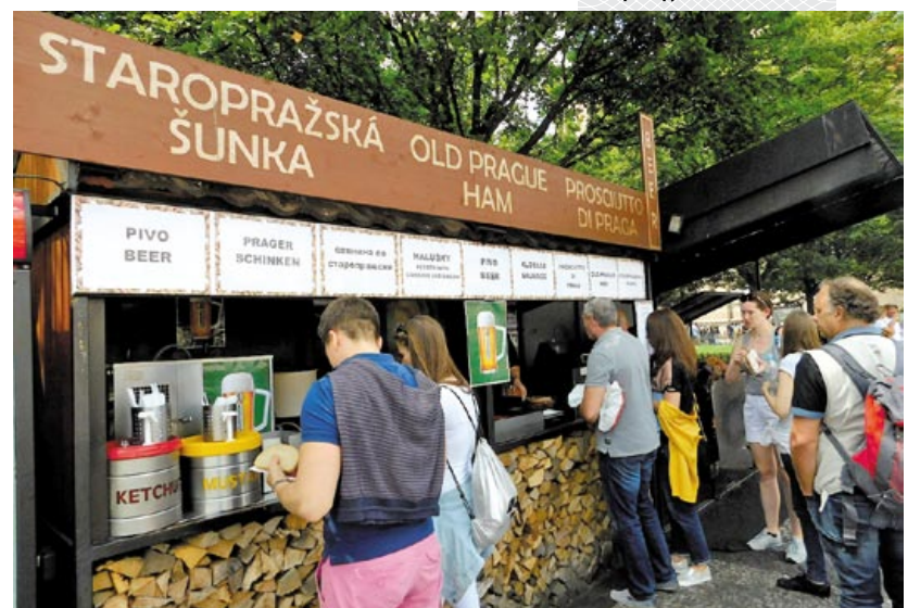
▼ Цяпер там, дзе некалі ў Празе друкаваліся скарынаўскія кнігі, можна паспытаць піва з мясцовым фастфудам