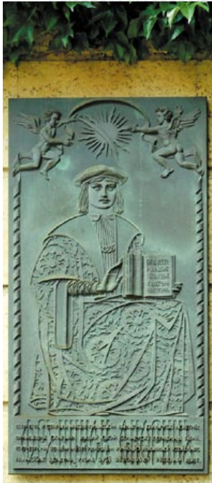
▲ Мемарыяльная шыльда, прысвечаная Ф. Скарыну, у пражскім Клеменцінуме

трэба ў бок яшчэ аднаго сімвала Прагі – Карлавага моста, на паўдарозе да якога мы заўважылі адзін з будынкаў Чэшскай нацыянальнай бібліятэкі. У адрозненне ад галоўнага кнігасховішча Беларусі, чэшская інтэлектуальная скарбніца месціцца ў добрым дзясятку старадаўніх пабудов, якія ўтвараюць агульны архітэктурны комплекс Клеменцінум. Сваю назву ён атрымаў ад узвездзенага некалі на яго тэрыторыі дамініканскага касцёла святога Клеменціна. Акурат тут, на сцяне аднаго з будынкаў галоўнага ўнутранага дворыка Клеменцінума, і адшукаўся прадмет нашай надзвычайнай цікаўнасці – прысвечаная Ф. Скарыну мемарыяльная дошка.