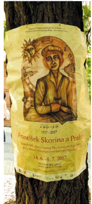
▲ Афіша з партрэтам Ф. Скарыны, прымацаваная на ствол дрэва ў скверы на Старамесцкай плошчы, як часова памятка пра знаходжанне ў гэтым месцы друкарні

Заўважыўшы на нашых тварах недаўменне, экскурсавод паспяшаўся нас заспакоіць: у чэшскай сталіцы ўстаноўлена мемарыяльная шыльда беларускаму першадрукару, але ў іншым месцы, прыкладна за паўкіламетра ад Старамесцкай плошчы. Зразумела, пасля гэтага паведамлення ўсёй сваёй кампактнай чародкай мы накіраваліся туды. Высветлілася, што ісці