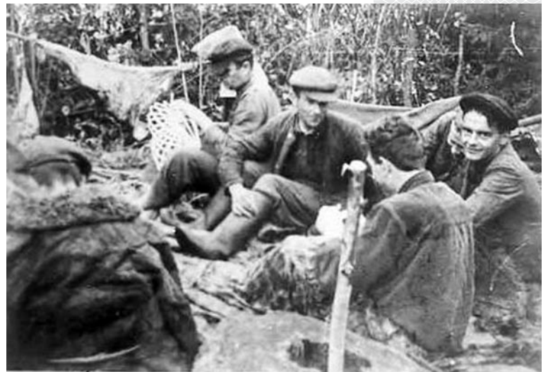
▼ Бандгруппа С. Миклулича.