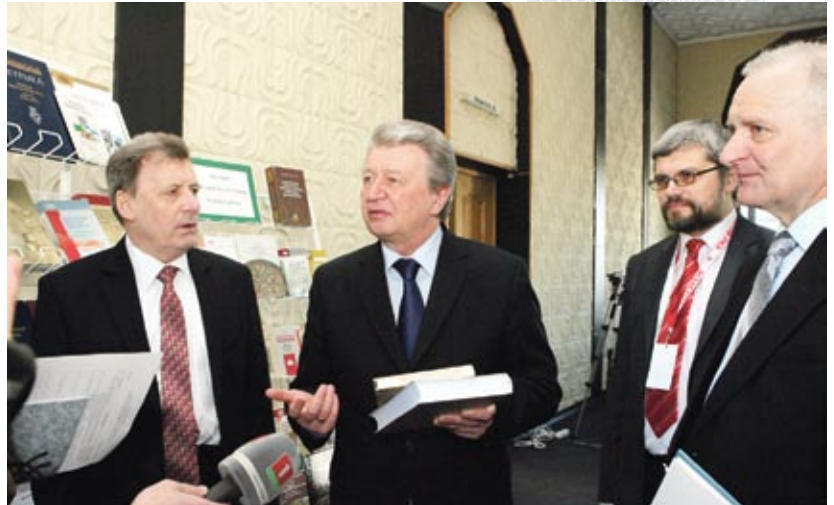
▲ У час навукова-практычнага семінара «Гісторыя беларускай дзяржаўнасці». Злева направа: акадэмік-секратар АДДзялення гуманітарных навук і мастацтваў НАН Беларусі А.А. Каваленя, першы намеснік кіраўніка Адміністрацыі Прэзідэнта Рэспублікі Беларусь А.М. Радзькоў, дырэктар Інстытута гісторыі В.В. Даніловіч, старшыня Прэзідыума НАН Беларусі У.Р. Гусакоў

Неабходна фарміраваць у душах беларускіх людзей, пачынаючы з дашкольнага ўзросту і працягваючы ў школе і ў сістэме вышэйшай адукацыі, пантэон герояў – сімвал моцы духу, інтэлектуальна-культурнага багацця і творчай велічы народа. Можна называць гэта патрыятычным выхаваннем, урокам гісторыі ці інфармацыяй для агульнага развіцця, але павінна быць сістэмная і мэтанакіраваная праца. У працэсе арганізацыі ідэйна-палітычнай і масава-асветнай работы нельга надта захапляцца формамі, каб не нашкодзіць зместу працы. Патрыятычнае выхаванне – перш за ўсё пытанне светаразумеання і светаадчування асобы, найважнейшы кампанент духоўна-культурнага стану грамадзяніна, што павінен быць стрыжнем ва ўсёй сістэме адукацыйна-выхаваўчага працэсу. Падрастаючаму пакаленню неабходна пастаянна расказваць пра гераізм, самаадданасць і працоўныя дасягненні беларускага народа. Гэтыя размовы павінны быць пранікнёнымі, каб моладзь і думкай, і сэрцам спасцігала сэнс подзвігу продкаў. Важна далучаць юнакоў і дзяўчат да самастойнай працы, прапаноўваць удзел