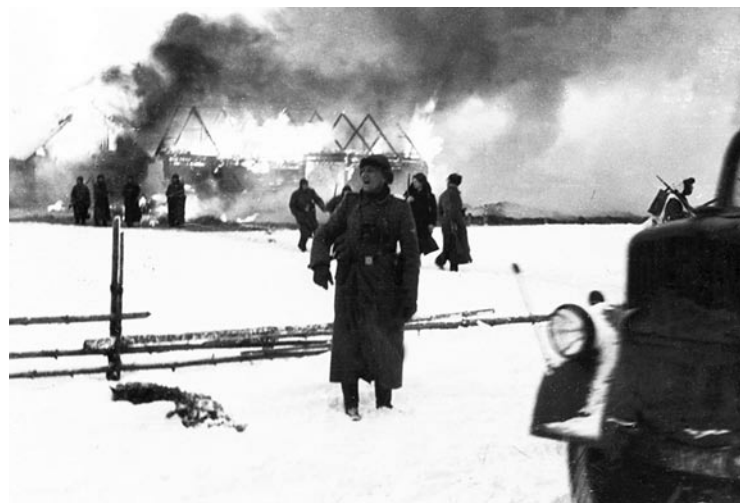
Немецкие каратели в Могилевском районе. 1943 год

Именно она, а точнее бесчеловечная политика геноцида, которую осуществляли на оккупированной территории Беларуси гитлеровцы, привела