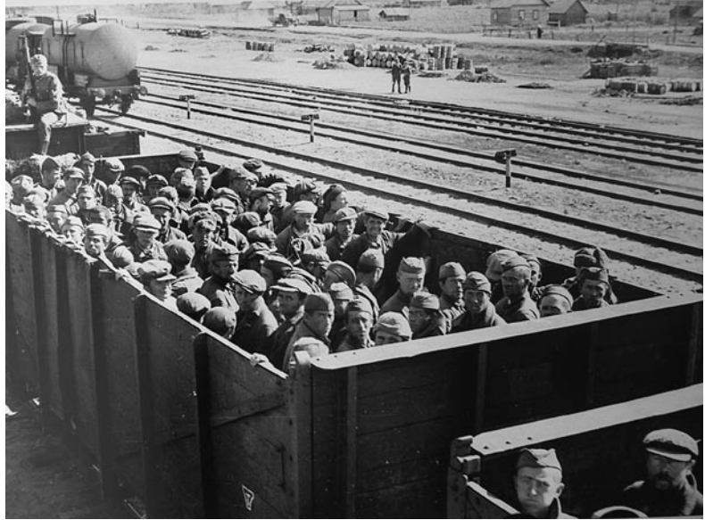
Советских военнопленных даже в тридцатиградусные морозы перевозили на открытых железнодорожных платформах. Немецкое фото середины 1940-х