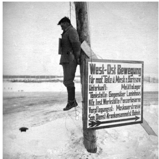
Шоссе Минск – Москва, 1941 год

Еще один архивный документ – акт ЧГК по Гомельскому району. Цитируем: «Сбор теплых вещей для немецких армий проводился с применением оружия. Так, в деревне Давыдовка на улице немцы