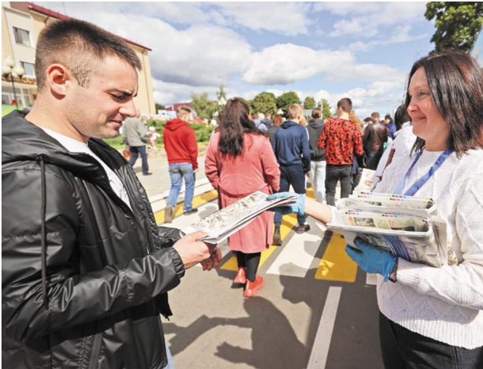
Дзень беларускага пісьменства – гэта заўсёды свята! Мінская вобласць, г. Капыль. Верасень 2021 года

зямлю, працуе на ёй, дбае пра Радзіму і род свой, годна рэагуе на праблемы, з якімі сустракаецца на дарозе жыцця. Няважна, якой прафесіі і заняткаў герой. Галоўнае, каб яго паводзіны ў мастацкім творы вучылі дабрны, сардэчнасці, любові адно да аднаго і веры – усяму таму, што вызначае Чалавечнасць.