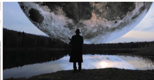
▲ Кадры из фильма «УНОВИС»

очень привлекает зрителя, любящего истории о реальных людях и событиях. Как пишет Б. Ирвин, исследовательница из Великобритании, «документальная драма – британский термин, относящийся к телевидению и кинопоказу, имитирующим реальные события, основанные на тщательном изучении темы и призванные вызвать дискуссию о значимости событий и изображаемых в них людей» [6].