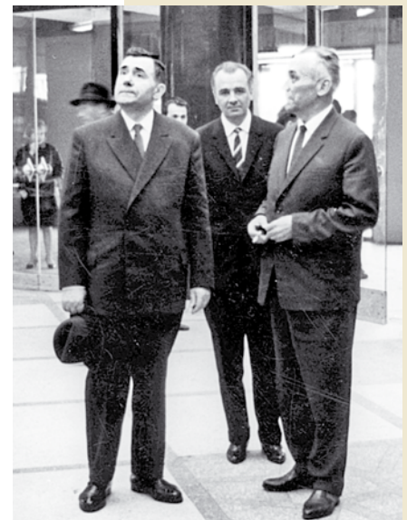
Візіт міністра замежных спраў СССР А.А. Грамыкі ў Мінск. Чэрвень 1974 года. Злева направа: А.А. Грамыка, А.Е. Гурыновіч, С.В. Прытыцкі