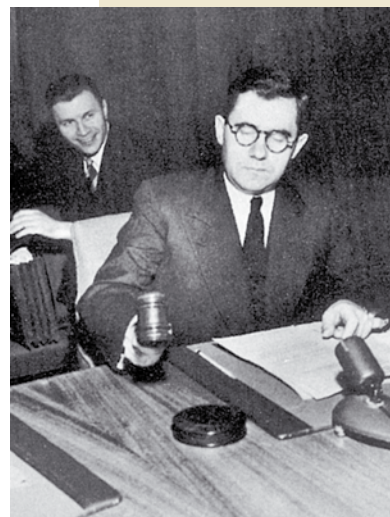
А.А. Грамыка старшыня на пасяджэнні Савета Бяспекі ААН. Сакавік 1947 года

«Нягледзячы на недахоп часу, Сталін усё ж знаходзіў магчымасць для работы ўнутры дэлегацыі, для гутарак, па крайняй меры, з тымі людзьмі, якія па сваім становішчы маглі выказаць меркаванні па праблемах, што разглядаліся, і якім даручалася