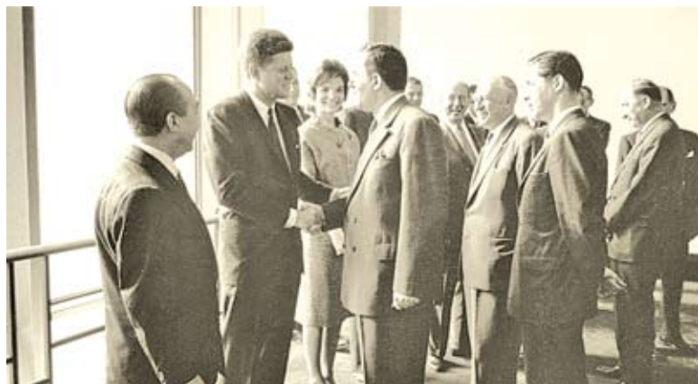
Сустрэча прэзідэнта ЗША Дж. Кенэдзі з савецкай дэле- гацыяй на чале з А.А. Грамыкам на XVI сесіі Генеральнай асамблеі ААН. Нью-Ёрк, 25 верасня 1961 года

падтрымліваць кантакты з членамі амерыканскай і англійскай дэлегацыяй», – пісаў А. Грамыка.