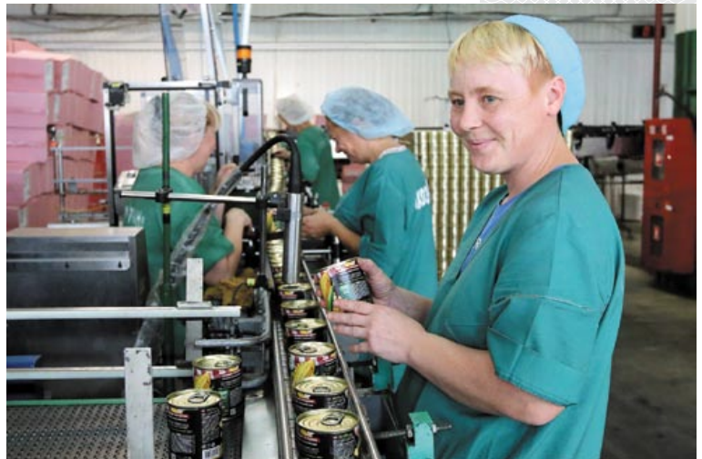
▲ Гатовая прадукцыя ААТ «Быхаўскі кансервава-агароднінасушыльны завод»

– На сённяшні дзень завод выпускае больш за 200 назваў прадукцыі, – працягвае Т. Корань. – Гэта джэмы, варэнне, павідла, кетчупы, соусы, сок, нектары, салаты, закускі, гарніры, кансерваваныя