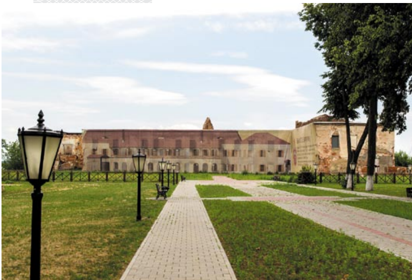
▼ Быхаўскі замак

– Ведаеце, што ў нядаўнім мінулым Быхаў негалосна называлі мілітарызаваным горадам? – інтрыгуе ён сваім пытаннем і адразу ж дае на яго адказ. – Прычым з ваеннай справай наш горад быў звязаны ці не ад самага свайго пачатку. Датай яго заснавання прынята лічыць 1370 год, і, калі верыць адной з гіпотэз паходжання назвы, на месцы цяперашняга горада «быў хоў», дзе навакольныя жыхары знаходзілі паратунак ад ворагаў. Ужо тады тут існавалі стара-