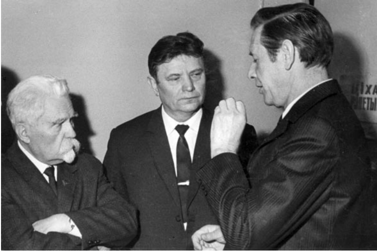
▲ Размова пра літаратуру і мастацтва. Першы сакратар ЦК КПБ П.М. Машэраў са старшынёй Саюза пісьменнікаў БССР Максімам Танкам і старшынёй Саюза кампазітараў БССР Рыгорам Шырмам. 1970-я гады

напрамкі, як паэтызацыя спаконвечных зямных асноў народнага жыцця, духоўна-маральных каштоўнасцей працоўнага асяроддзя, працы хлебараба, арагата, сейбіта, філасофска-аналітычнае асэнсаванне складанай і супярэчлівай дыялектыкі прыватных з'яў і гістарычных працэсаў, шматстайнай прычынна-выніковай сувязі асобы і грамадства, раскаванасць мастацкага мыслення, набліжэнне мовы паэзіі да мовы прозы, умоўна-асацыятыўная вобразнасць і г.д.