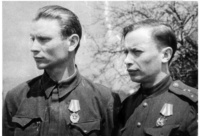
▲ Максім Танк і Аркадзь Куляшоў у гады вайны

Кнігі М. Танка «На этапах», «Журавінавы цвет» (1937), «Нарач» (1937) і «Пад мачтай» (1938), вершы і паэмы сталіся лепшымі ў заходнебеларускай літаратуры. Творчасць паэта сведчыла жыццёстайкасць белару-