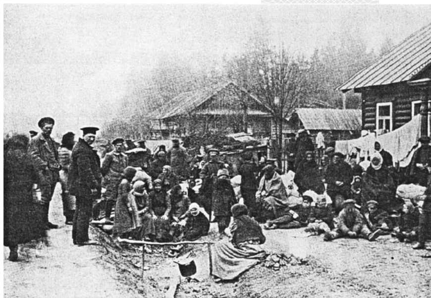
▲ В беженском лагере. 1915 год

На заседании специально было рассмотрено предложение Комитета великой