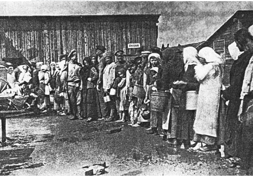
▲ Очередь беженцев возле пункта выдачи бесплатных пайков. 1915 год

предписывалось «все пространство в тылу позиций корпусов впредь разделять на две полосы». Причем обязанность поддержания порядка движения в ближайшей к боевой линии возлагалась на войска, а далее – на начальника этапно-хозяйственного отдела штаба армии. При отступлении в новый район расположения войскам было приказано «немедленно оповещать население... о том, что всем жителям предоставляется оставаться на своих местах, а если кто хочет выселиться, то должен уходить не позже как в течение суток со времени прибытия в этот район войск и обозов». Позже этого срока предписывалось «никакого движения беженцев не только партиями, но и в одиночку не допускать» [3, л. 666].