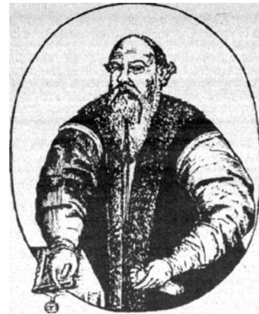
Портрет (гравюра) Альберта Гаштольда

приобретать на территории государства недвижимость. Мы имеем определенные основания считать, что предложенные нормы А. Гаштольдом и изложенные в ст. 25, разд. I Статута 1529 года [8, с. 40–41] были сформулированы под влиянием римского частного права, а именно в их основу был положен beneficium principale Юстиниана [7, с. 38].