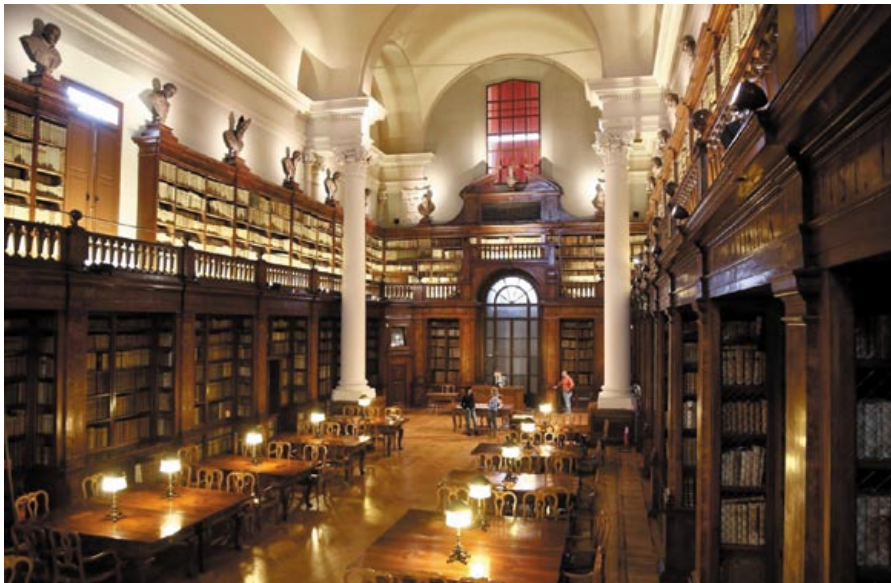
Библиотека Болонского университета