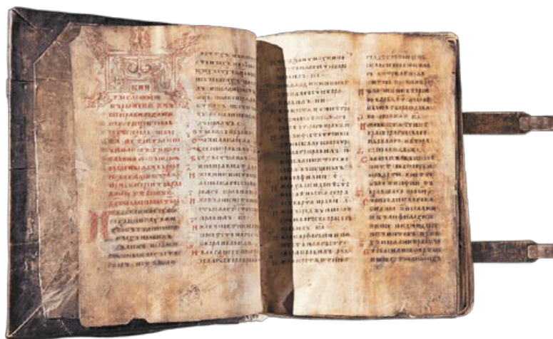
Кормчая книга. Иловичский список 1262 года

То, что началось в Болонье, продолжили другие итальянские и французские юридические школы в Падуе, Париже, Бурже, которые посещались представителями многих стран Европы. В XV веке в числе студентов Болонского университета были и уроженцы наших земель – Альберт Гаштольд и Ян Радзивилл [7, с. 38]. Знания, полученные ими в Болонском университете, были использованы при подготовке первого Статута Великого Княжества Литовского, Русского, Жемойтского в 1529 году. В частности, А. Гаштольд с 1522 года был канцлером ВКЛ и возглавлял комиссию по созданию Статута 1529 года. Именно по его инициативе в указанный Статут были включены правовые нормы о том, что лица, не являющиеся уроженцами ВКЛ, не имеют права занимать государственные должности,