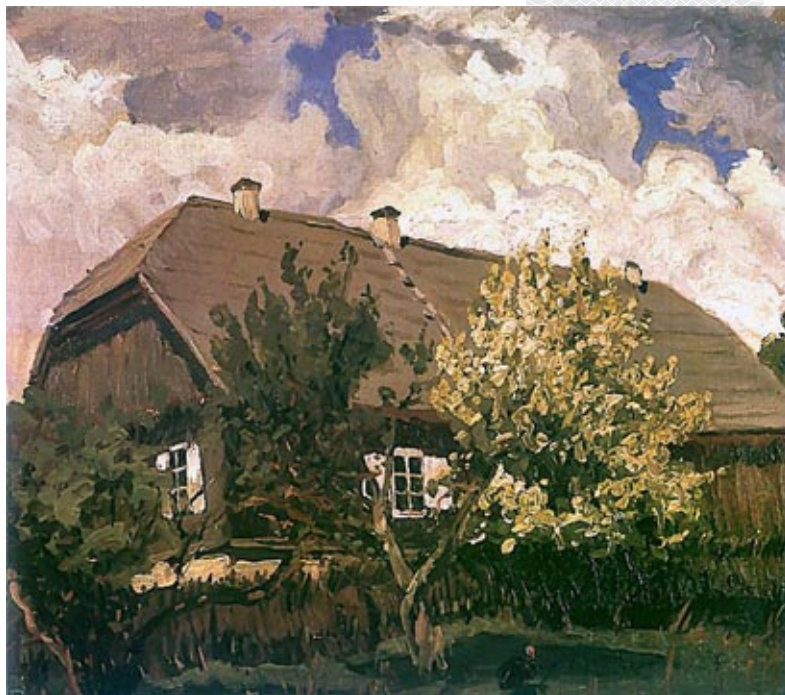
▲ «Дом у Багданаве». 1902 год

Гадавіна з дня нараджэння Фердынанда Рушчыца ўпершыню шырока адзначаецца ў Беларусі. Адна з падзей святочнага календара – V Рэгіянальны пленэр юных мастакоў-пейзажыстаў «Зямля і неба Фердынанда