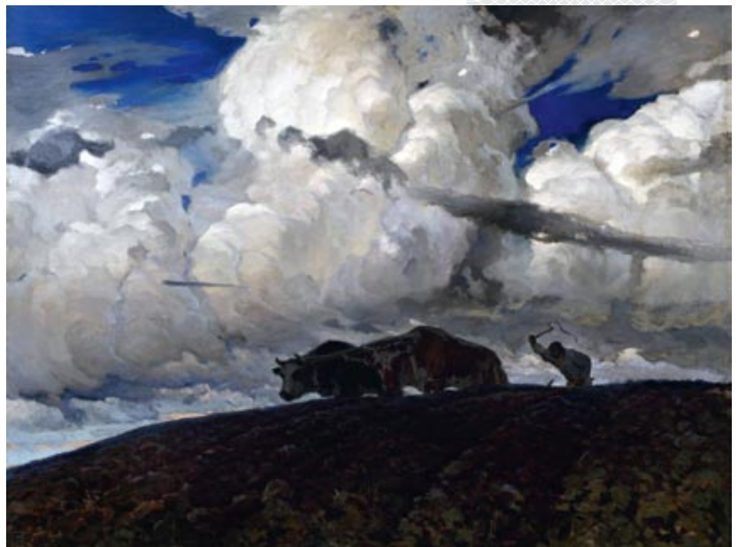
▼ «Зямля». 1898 год

З 1908 года Фердынанд Рушчыц стала жыў у Вільні. 10 кастрычніка 1913 года 43-гадовы мастак ажаніўся з Рэгінай Гінай