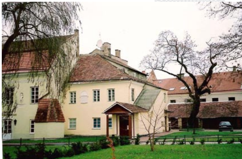
▲ Вільня. Вул. Пілес, 22. У вохрыстым корпусе жыў Ф. Рушчыц