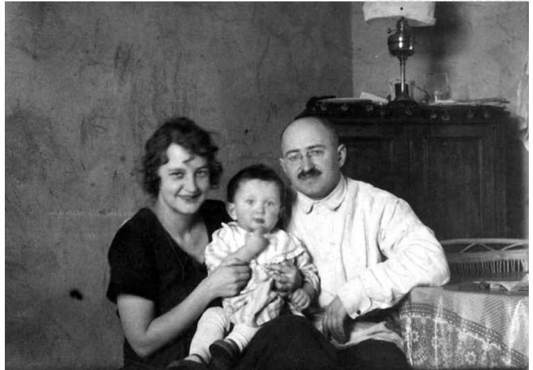
▲ Браніслаў Тарашкевіч з жонкай Верай і сынам

Неардынарная асоба, унікальны навуковец, вучоны-патрыёт, грамадскі дзеяч, пісьменнік, перакладчык і публіцыст –