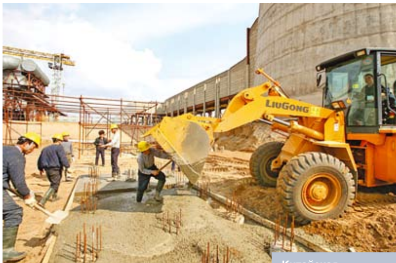
Китайская корпорация по зарубежному экономическому сотрудничеству принимает участие в строительстве второго энергоблока Минской ТЭЦ-5

сотрудничеству. Китай занимает 1-е место в мире по золотовалютным запасам и располагает значительными инвестиционными ресурсами [2, с. 30].