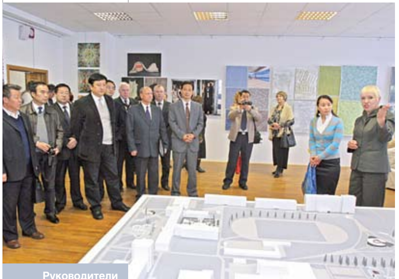
Руководители университетов КНР во время посещения Витебского государственного технологического университета. Октябрь 2010 года

Есть основания надеяться, что с принятием Директивы № 4 Беларусь станет более привлекательной для иностранных инвесторов, в том числе и китайских. Это обязательно произойдет, если органы местного управления будут неукоснительно придерживаться главного принципа, прописанного в Директиве: «конкуренция – везде, где возможно, государственное регулирование – там, где необходимо».