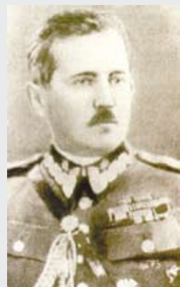
Булак-Балаховіч на польскай службе