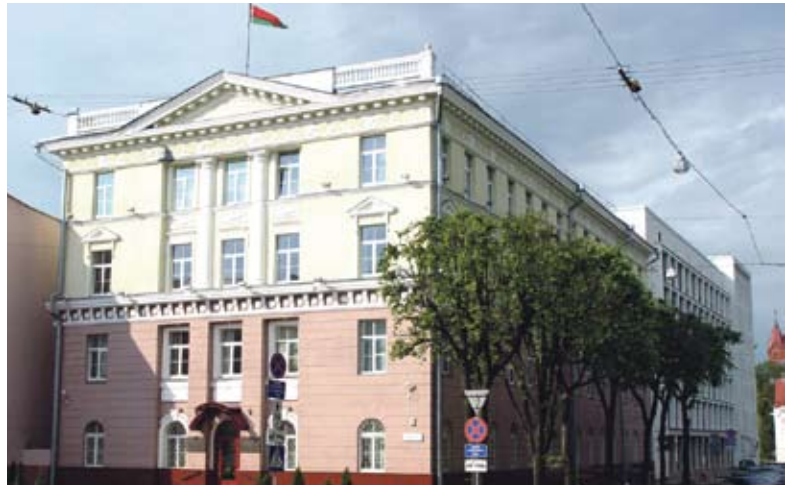
Здание Высшего хозяйственного суда

Вот почему на том же заседании, о котором я говорю, руководителям подразделений горисполкома и организаций города было настоятельно рекомендовано продолжить реализацию комплекса профилактических мероприятий по предупреждению экономической несостоятельности (банкротства), особенно организаций, имеющих значение для экономики страны и социальной сферы. Так, в отношении ООО «Экслита» в середине октября 2011 года в хозяйственном суде Витебской области на исполнении находилось 8 исполнительных производств. Общая сумма задолженности, подлежащая взысканию, – 104 млн рублей. Причем судебным исполнителем в течение 2010–2011 годов исполнительные документы возвращены взыскателям без исполнения с актом о невозможности взыскания по 102 исполнительным производствам. Должник по юридическому адресу не находится, хозяйственную деятельность не осуществляет более полутора лет. Представ-