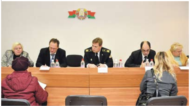
Судьи и старший судебный исполнитель хозяйственного суда Минска провели совместный прием граждан и представителей субъектов хозяйствования по вопросам правоприменительной практики в хозяйственной деятельности

– Благодаря перечисленным нововведениям отечественные субъекты хозяйствования, равно как и их иностранные партнеры, получили возможность выяснить отношения между собой по заключенным договорам в претензионном порядке и в примирительной процедуре без вступления в публичное судебное разбирательство. Иными словами, они приобрели шанс сберечь взаимные деловые отношения, сохранить свой имидж и авторитет, сэкономить финансовые средства и время.