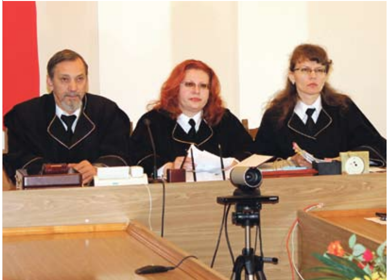
Кассационная коллегия Высшего хозяйственного суда

Впервые сформулированы в действующем ХПК нормы о специальной подведомственности. Эти нормы позволили сконцентрировать рассмотрение в хозяйственных судах наиболее актуальных экономических споров, вытекающих из учредительства, или корпоративных споров, дел о банкротстве, государственной регистрации и т.д.