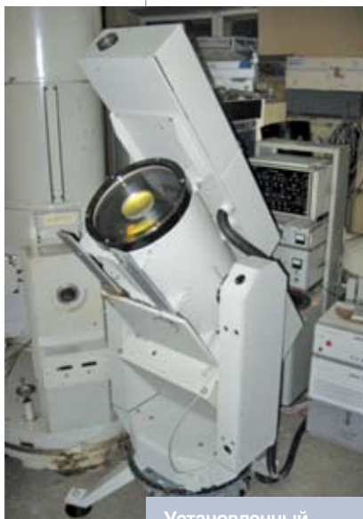
Установленный в Институте физики НАН Беларуси многоволновой лидар с рамановскими каналами входит в Европейскую лидарную сеть EARLINET

Измерения в рамках сетей EARLINET и CIS-LiNet показали, что пылевые бури пустынь Африки, Центральной и Средней Азии загрязняют атмосферу Европы, Восточной Сибири, Приморского края и альпийской зоны Тянь-Шаня. Реакция природных комплексов не однозначная.