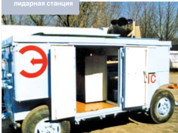
Созданная белорусскими учеными передвижная лидарная станция

– Озон – одна из самых изменчивых составляющих земной атмосферы. Общее содержание озона (ОСО) над каждым конкретным регионом определяется фотохимическими процессами образования и разрушения в верхней стратосфере и процессами переноса воздушными массами в более низких слоях, – отметил Аркадий Петрович. – Согласно измерениям, величина ОСО на территории Беларуси меняется в диапазоне 220–450 единиц Добсона. Характерным является формирование повышенных значений максимумов концентрации в весенний период и их уменьшение во втором полугодии. Мы осуществляем мониторинг аэрозоля в верхней тропосфере и стратосфере одновременно с измерениями профилей концентрации озона. Лидарные