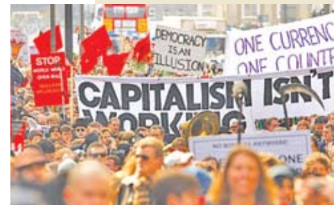
Демонстрация в Лондоне

Таким образом, эти международные организации по своей сути представляют собой клубы для министров финансов, руководителей центральных банков и министров экономики и торговли, выражающие интересы политических и экономических элит высокоразвитых государств.