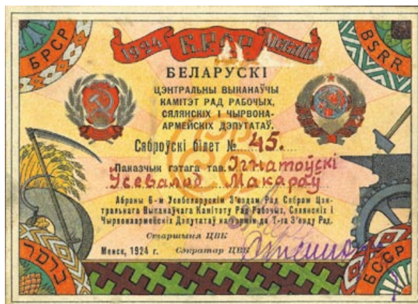
Одна из вариаций герба Беларуси на бланке служебного удостоверения. 1924 год

государственного художественного техникума в Витебске и еще 27 эскизов выполнили учащиеся этого учебного заведения [6, л. 79].