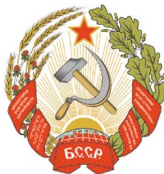
Герб БССР. 1927 год