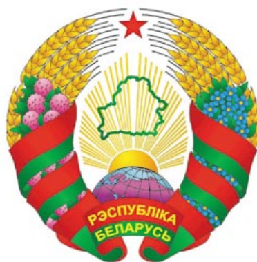
Государственный герб Республики Беларусь. 2005 год