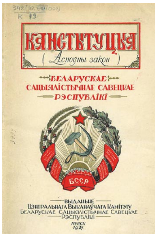
Герб БССР на обложке Конституции 1927 года