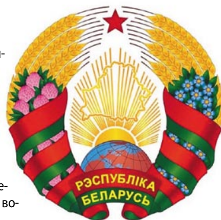
Государственный герб Республики Беларусь. 2021 год

Национально-государственные символы оказывают влияние на социум и отражают наиболее устойчивые, типичные черты исторического развития общества. Современные социально-политические процессы продолжают активно во-