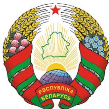
Государственный герб Республики Беларусь. 1995 год