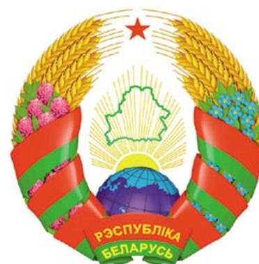
Государственный герб Республики Беларусь. 2012 год

а наоборот приводили их к разобщению, потому что бело-красно-белый флаг и гербовая эмблема «Погоня» отражают интересы только определенной группы людей, отвергающих вклад белорусского народа в Победу над фашизмом и экономический расцвет Республики в послевоенный период» [13, л. 61].