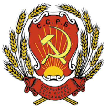
Герб ССРБ. 1919 год