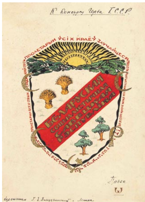
Два конкурсных проекта герба БССР. Художник Г. Змудзинский. 1920-е годы

При взгляде на рисунок первого советского герба Беларуси бросается в глаза его схожесть (кроме названия республики) с существовавшими тогда гербами РСФСР и УССР, что в то время было вполне закономерным явлением.