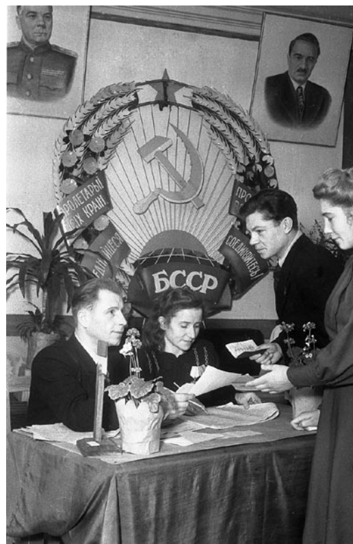
На избирательном участке в г. Минске. 1950 год