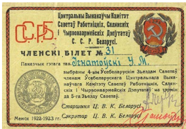
Одна из вариаций герба Беларуси на бланке служебного удостоверения. 1922–1923 годы