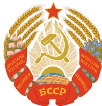
Герб БССР. 1981 год