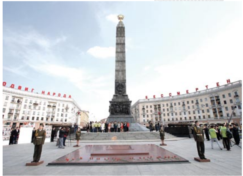
▲ Площадь Победы в Минске

В возведении величественного монумента принимали участие представители многих народов СССР. Гранит на облицовку был привезен из-под Днепропетровска и Житомира, мозаику для ордена Победы прислали из Академии художеств Ленинграда, резьбу по граниту выполнили украинские каменотесы, бронзовые горельефы, меч и венки отливали ленинградские умельцы завода «Монументскульптура».