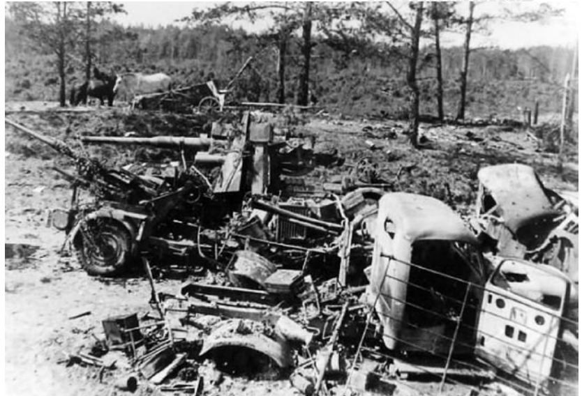
▲ Уничтоженная немецкая техника в районе моста через Березину

Победа в Великой битве за Беларусь была оплачена дорогой ценой. В операции «Ба-