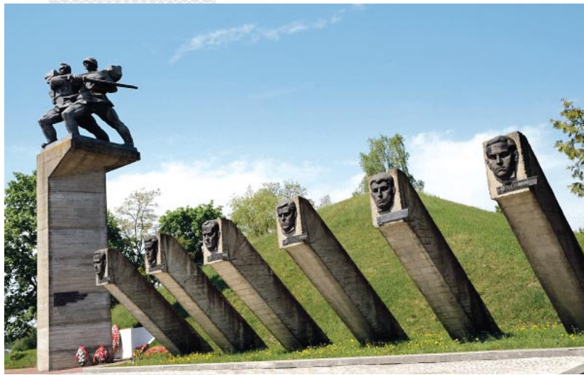
▼ Мемориальный комплекс «Сычково», Бобруйский район

В период осуществления стратегической операции «Багратион» проходили сотни местных боев. Штурм безымянной высоты 150,9 был задуман командованием 1-го Белорусского фронта для отвлечения основных сил врага от главного направления удара войск фронта. Две ударные роты 558-го полка 169-й стрелковой дивизии в ночь на 24 июня 1944 года, прорвав оборону противника, захватили господствующую высоту 150,9 в треугольнике между деревнями Лудчицы, Яново, Комаричи Быховского района. Оказавшись отрезанными от других подразделений полка, командиры организовали оборону. За 19 часов сражения бойцы отразили множество контратак противника. Большинство бойцов штурмо-