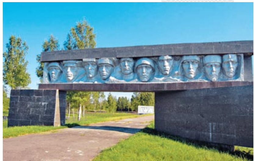
▼ Мемориальный комплекс «Рыленки»

Основную композицию мемориала составляют 164 плиты с именами похоронен-