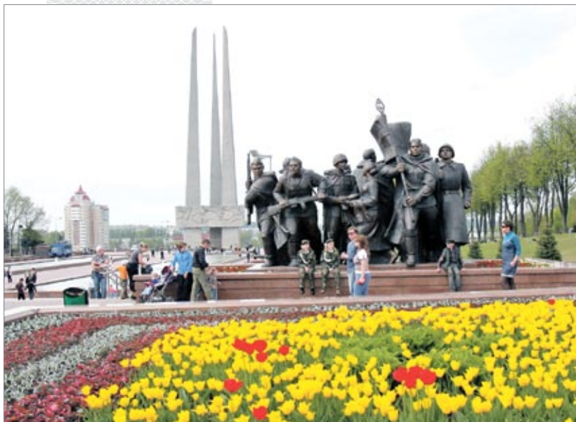
▲ Мемориальный комплекс в честь советских воинов-освободителей, партизан и подпольщиков в Витебске