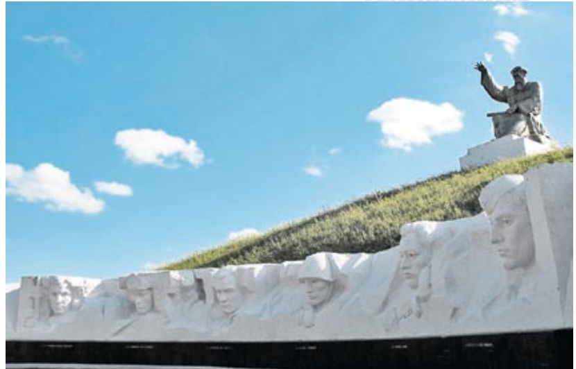
▲ Мемориал воинской славы «Лудчицкая высота»

Жители Витебщины осуществили огромную работу по увековечению событий войны. На территории области более 2,5 тыс. мемориальных комплексов, мест боевой и