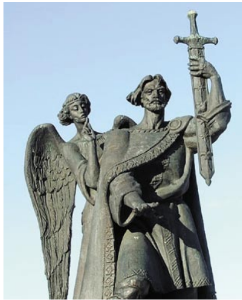
◀ Князь Барыс Усяславіч Полацкі. Помнік у Барысаве

Кожны з гэтых князёў, акрамя Ізяслава Уладзіміравіча (які памёр маладым), кіраваў Полаччынай па некалькі дзясяткаў гадоў і ў свой час быў ушанаваны жыхарамі Полацкай зямлі. І сёння яны вартыя ўдзячнай памяці народа. Гэты артыкул – спроба нагадаць пра апошняга з вялікіх полацкіх князёў – Барыса Усяславіча (каля 1050–1128).