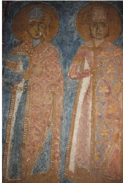
◀ Барыс і Глеб. Фрэска. Спаса-Праабражэнская царква Спаса-Еўфрасіннеўскага манастыра, г. Полацк

Аднак, як аргументавана адзначаюць даследчыкі старажытнарускага княжацкага антрапанімікона, «калі нават прытрымлівацца версіі, паводле якой згаданы ў Маскоўскім летапісным зборы Васіль з’яўляецца сынам Рагвалода, гэтага зусім не дастаткова для атаясамлівання яго з Рагвалодам-Васілём