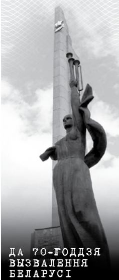
ДА 70-ГОДДЗЯ ВЫЗВАЛЕННЯ БЕЛАРУСІ

Как явствует из писем отца, он попал на фронт в ноябре 1941 г., сообщал, в частности, что «воюет уже две недели, пока ничего с ним не случилось, а мы бьем фашистов...». Правда, сквозь бодрый дух (а в условиях жесткой военной цензуры иначе