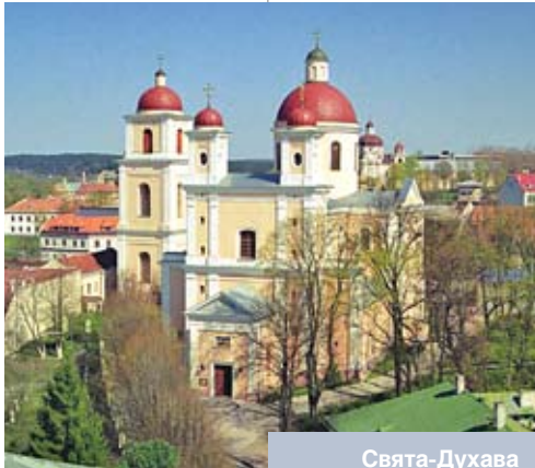
Свята-Духава царква ў Вільнюсе. Сучасны выгляд

Арышт Свята-Духава архімандрыта супаў з вельмі моцным пажарам, які 1 ліпеня 1610 года знішчыў, як даводзяць сведкі, палову Вільні, не крануўшы, аднак, брацкіх будынкаў. Цікава, што згарэлі 11 цэркваў, якія Пацей адабраў у праваслаўных і перадаў уніятам некалькі месяцаў таму. Свядомасць сучаснага чалавека, выхаванага ва ўмовах свецкай культуры, натуральна, успрымае гэтую падзею не больш як выпадковасць, але для веруючых віленцаў у сітуацыі вострага канфесіянальнага процістаяння гэты пажар быў літаральна знакавым.