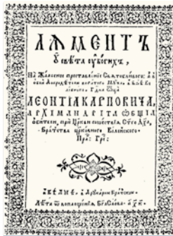
«Лямант» на смерць Лявонцiя Карповiча. Вiльня, 1620 год

Вядома, што нятленны астанкi архiмандрыйта Лявонцiя Карповiча некаторы час знаходзiлiся ў Свята-Духавай царкве, а самога яго ў першыя дзесяцiгоддзi пасля скону шанавалi як святога спаведнiка. Аб гэтым даведваемся, у прыватнасцi, з «Мнемазiны», якую паднеслi Пятру Магiле пры яго ўступленнi на Кiеўскую мiтраполiю ў 1633 годзе студэнты Кiеўскай калегii. Святым называе Лявонцiя Карповiча i Афанасiй Фiлiповiч у сваiм знакамым «Дыярышы» (1648). Сярод святых згадваецца