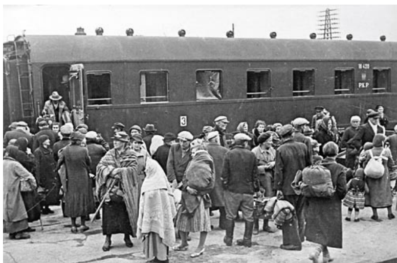
Возвращение белорусов-беженцев в родные места. Белосток, 1939 год

Для справедливости нужно отметить, что такое положение не удовлетворяло