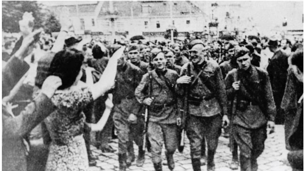
Встреча воинов-красноармейцев. Западная Беларусь, 1939 год

ния. Усвоение национального исторического опыта – не только важнейший духовно-мировоззренческий потенциал развития общества, но и источник формирования гражданских и патриотических качеств подрастающего поколения. Ведь не зря народная мудрость гласит: только тот, кто усвоил уроки прошлого, способен предвидеть будущее.