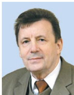
Александр КОВАЛЕНЯ, академик, доктор исторических наук, профессор

Александр КОВАЛЕНЯ. День народного единства – символ исторической общности белорусского народа и национальной государственности. В статье раскрывается общественно-политическая значимость воссоединения белорусского народа осенью 1939 года и учреждения государственного праздника Дня народного единства. Обосновывается политическая важность праздника как символа исторической общности белорусского народа и государственности, подчеркивается необходимость утверждения и закрепления праздничной даты в общественном сознании. Раскрывается сущность политики польского руководства, которая осуществлялась на территории Западной Беларуси в межвоенный период, и планы польской элиты в отношении восточных территорий в наши дни.