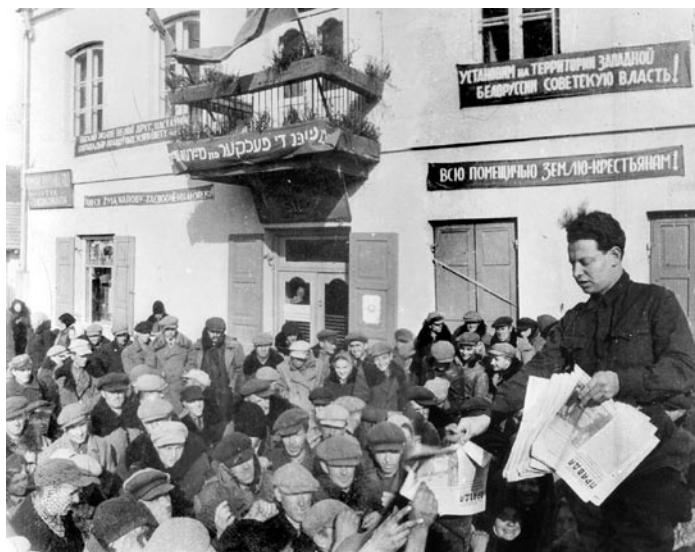
На митинге в Сморгони, посвященном воссоединению Западной Беларуси с БССР. 1939 год

Вам, дарагія браты, прывітанне, Усе нашы радасці новага дня [1, с. 48].