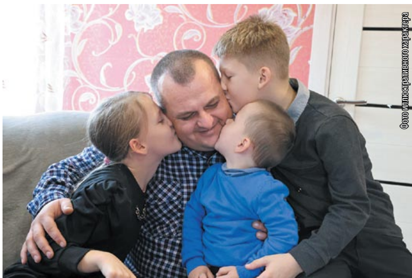
Фото иллюстративного характера

Семья как социальный конструкт представляет собой выделенное пространство, которое определено для нее социальной системой. Семья, будучи составной частью социальной реальности, является образованием, значимость которого превышает размеры ее внутренней структуры. Это структурный элемент сообщества, обеспечивающий наиболее оптимальное и эффективное функционирование в социуме. Семья как социальный конструкт описывается на основе анализа социально-экономической и культурной реальности общества. Воспроизводство семьи в любом обществе одновременно организуется, контролируется и совершенствуется посредством процедур, направленных на нейтрализацию ее непредсказуемости. Речь идет о процедурах запрета (к примеру, табу на инцест и кровосмесительные браки), разграничение нормального и аномального (к примеру, посредством выработки социальными службами и системой образования образца для подражания – модели «благополучной» семьи). Модель семьи рассматривается как система повторяющихся внутри нее событий, которые обусловлены образ-